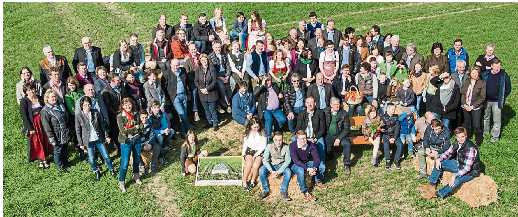
Mit der Initiative „HeimatLandwirte“ wollen rund 85 Landwirte aus dem Landkreis Landshut und dem Landkreis Kelheim der Landwirtschaft ein Gesicht geben.