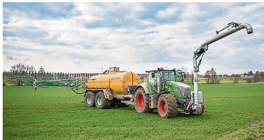
Das wollen die „HeimatLandwirte“ deutlich machen: Landwirt sein, bedeutet nicht nur, mit großen Maschinen auf dem Feld zu arbeiten. Landwirt sein bedeutet auch, sich im Stall um jedes einzelne Tier zu kümmern.