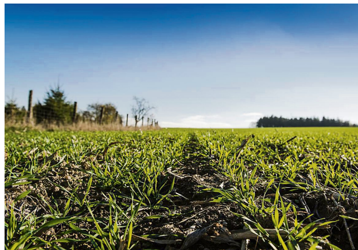
Fruchtbarer Boden ist das Kapital der Landwirte. Sie pflegen ihn mit all ihrem Wissen und Können, um ihn zu erhalten.